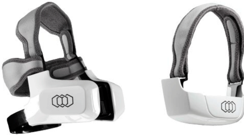
Equipo no invasivo 'Evoke de Inmode' que combate la flacidez en el arco mandibular y cúmulos de grasa en la zona submental (papada).

Consiste en siete pasos: comienza con una doble limpieza para eliminar el maquillaje y las impurezas, y un peeling para preparar la piel. A continuación, se aplica el 'Forma de Inmode' sobre cara, cuello y escote, es decir, una radiofrecuencia bipolar subdérmica indolora que calienta la piel hasta una temperatura máxima de 43°C, proporcionando una contracción de los tejidos de forma inmediata y mantenida en el tiempo ('skintightening' o tensado cutáneo).