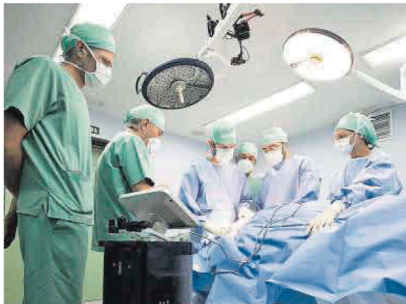
Cirujanos de HPS utilizando la tecnología Bodytite.